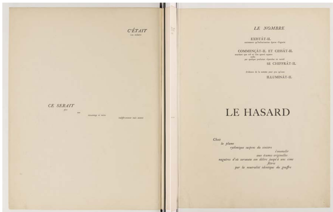
Fig. 5 : Stéphane Mallarmé, Un Coup de dés jamais n'abolira le hasard , 1887, Paris, Armand Colin, p. 9 © BnF.

Pour insérer l'image d'une page du Coup de dés , on a besoin de l'encadrer d'un liseré : c'est un trait de même nature que celui qui, dans la figure 3, encadrerait l'alleluia. Il trace le bord de la page « sonore » par rapport à la page qui ne l'est pas. Si on le supprime, la tension entre le haut et le bas de la page se dilue. Le son disparaît en quelque sorte, du moins la modalité sonore qui doit accompagner la lecture. Mallarmé, lui, pensait le livre comme autonome, donc des pages complètement blanches, sans limite, continues.