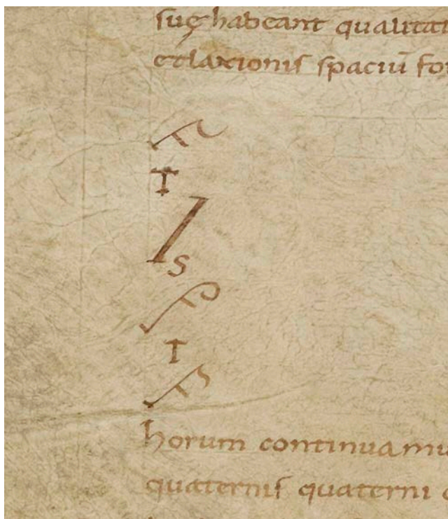
Fig. 1 : Musica Enchiriadis, IX e siècle, Valenciennes, BM 337, fol. 42v © BnF.

C'est d'ailleurs ce que marque explicitement l'écriture qui les analyse : l'écriture des ptongues ressemble à des lettres, mais celles-ci diffèrent des lettres alphabétiques en ce qu'elles n'ont rien de conventionnel : leur forme est signifiante et porte visuellement la logique de cet engendrement. Ce sont les lettres dites « dasianes », du mot grec dasia qui signifie souffle, et dont la base est le H, signe d'une aspiration (fig. 1). On le coupe en deux, ce qui donne un †, tau jacens , « T couché », qui forme la base du système, sa colonne vertébrale pour ainsi dire. Selon la place de la ptongue , on combine ce † avec trois signes : la moitié supérieure d'un C coupé en deux ; la moitié inférieure de ce même C ; et un S un peu couché (que l'on peut aussi considérer comme l'assemblage de ces deux moitiés). Ces trois signes marqueront les extrémités délimitant chaque intervalle de Ton, trois signes pour deux tons. Le Demi-ton est marqué par une autre lettre, un I incliné. Cela fait donc quatre signes, quatre ptongues , trois intervalles.