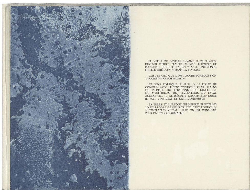
Fig. 2 : Novalis, Petr Herel, Fragments et grains de pollen, 1980, Losne, Th. B. & Labyrinth Press. Aquatinte. © Sophie Herel © BLJD.

Les six aquatintes ne sont pas du même bleu, mais présentent une variation de ce bleu, qui peu à peu s'assombrit vers un bleu nuit semblable à celui de l'encre. S'il se passe quelque chose dans cet espace bleu et ses grains de pollen, il est difficile de dire quoi, ce qui est assez constant dans les œuvres de Petr Herel, qui semblent défier les mots. Est-ce un univers peuplé de galaxies, de comètes, de trous noirs, de déchirures — ou bien au contraire la terre vue de l'espace, avec on ne sait quels courants marins, nuages, lacs et cratères ? Mais, terre ou ciel, s'impose l'idée de l'espace, idée que diffusent les fragments de Novalis où reviennent les termes « ciel », « terre », « univers », « lumière », ou « étoiles » (fig.2).